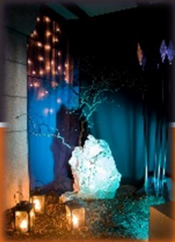
Gefangennahme in Gethsemane